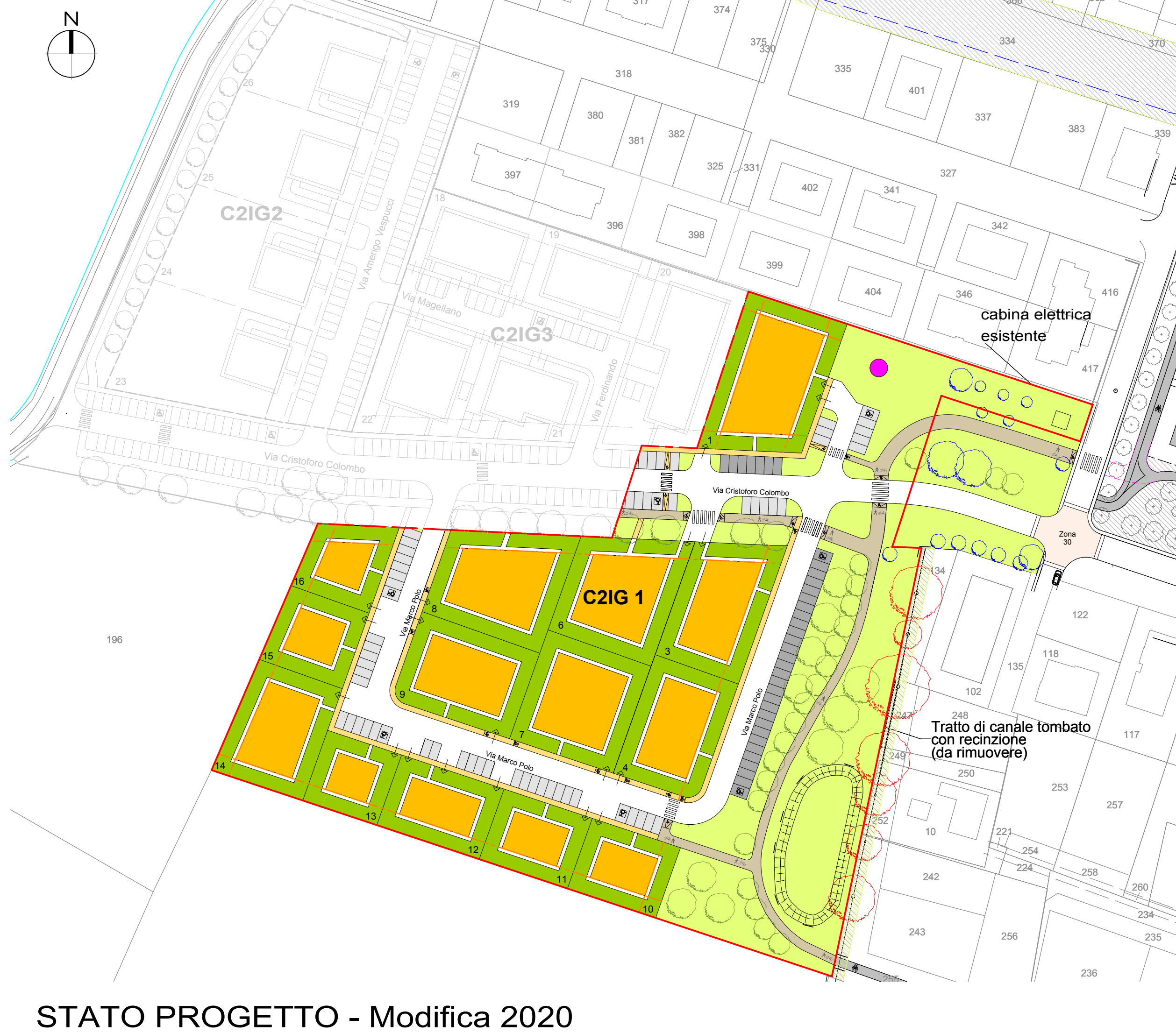
STATO PROGETTO - Modifica 2020