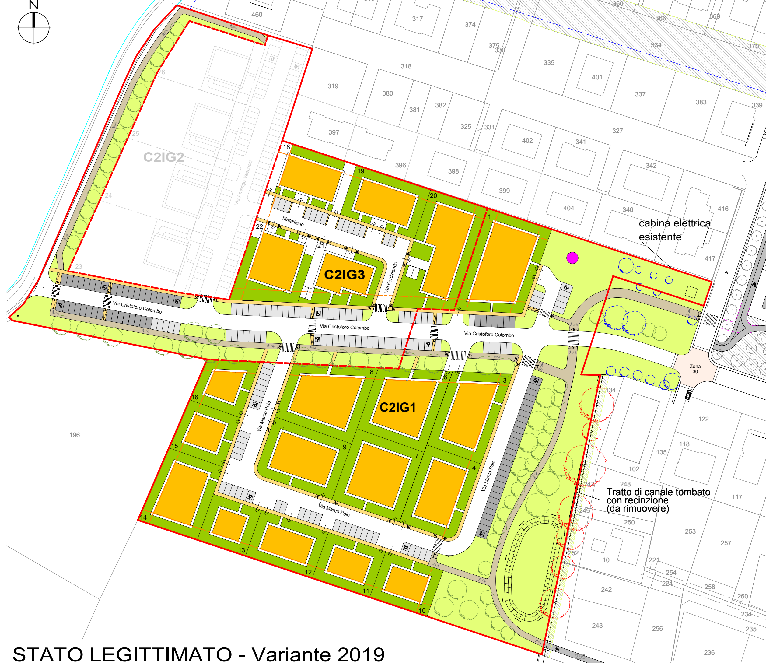
STATO LEGITTIMATO - Variante 2019