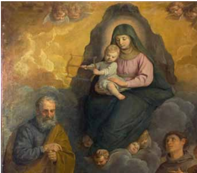
Simone Cantarini - (Pesaro, 1612-Verona, 1648), 1637

Questi sono i principali obiettivi della mostra allestita al Museo Benedettino e Diocesano d'Arte Sacra di Nonantola dove dal 16 marzo sono esposte circa 70 opere recuperate dalle chiese della Bassa danneggiate dal sisma: si potranno ammirare circa quaranta dipinti tra cui capolavori di maestri della scuola emiliana, bolognese, ferrarese e modenese, quali Scarsellino, Giuseppe Maria Crespi, Simone Cantarini, Sigismondo Caula ed Adeodato Malatesta, accanto ad antiche sculture lignee e in terracotta, reliquiari, argenti e scagliole tra XV e XIX secolo. L'opera maggiormente significativa e di straordinario valore artistico è la tela del Guercino raffigurante la Madonna col Bambino e S. Lorenzo dipinta nel 1624, proveniente dalla chiesa del Seminario di Finale Emilia.