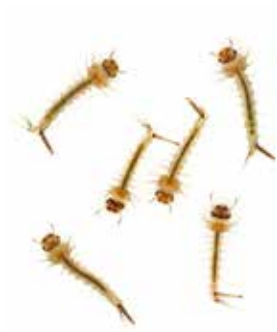
larve di zanzara

di copertura, una cisterna... sono tutti luoghi ideali per lo sviluppo delle larve di zanzara. Evitiamo per questo ogni ristagno d'acqua. Eliminiamo tutti i possibili contenitori di acqua all'aperto e usiamo i prodotti larvicidi per i ristagni d'acqua non eliminabili (tombini, grigliati per la raccolta delle acque piovane... ). I prodotti larvicidi sono facilmente reperibili nei supermercati, nei negozi specializzati, nelle farmacie. Usiamoli periodicamente, secondo le indicazioni riportate nelle etichette.