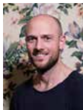
NICOLA XELLA - direttore della fotografia

Classe 1984, nasce ad Imola, dove fin da giovanissima si dedica al teatro e al video. Durante l'università trascorre un anno presso la UCLA School of Film and Television e quando si laurea in Scienze della Comunicazione i suoi cortometraggi hanno già girato festival internazionali. Ammessa al Centro Sperimentale di Cinematografia, si trasferisce a Roma dove lavora nei grandi set cinematografici prima come assistente e poi come regista di backstage e seconda unità, oltre che come filmmaker per produzioni televisive.