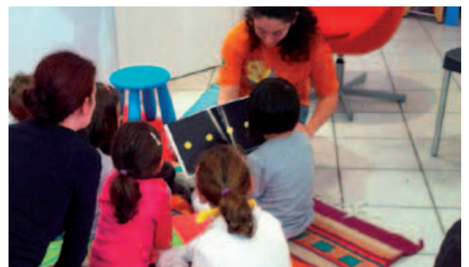
L'Angolo delle Storie

Continuano, invece, gli incontri del neonato Gruppo di Lettura Nati per Leggere aperto a tutti coloro, genitori, nonni, educatori, volontari, che appassionati di lettura per l'infanzia, abbiano voglia di condividere letture, pensieri, buone pratiche. Il prossimo incontro si terrà giovedì 5 dicembre alle ore 21 presso la sezione ragazzi della biblioteca in via Roma 30.