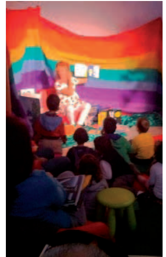
Letture "Nati per Leggere"