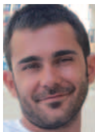
Federico Di Stefano Assessore all'Istruzione del Comune di Nonantola