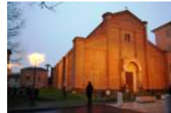
Il pezzetto di strada tra v. Vittorio Veneto e l'Abbazia è l'unico luogo di socialità e di incontro di oggi, dove poter trovare ancora qualcuno fermo a parlare, a discutere a osservare. La "piazza di Nonantola"?