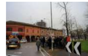
Snodo principale che mette in rapporto diverse aree urbane. Grandi criticità di sicurezza stradale.