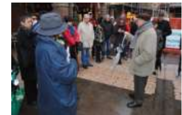
Importante per la riqualificazione è anche la riapertura della Torre con ricollocazione della Scuola musicale. La pavimentazione "racconta" la storia del luogo.. esempio interessante ma forse non è sufficiente?