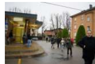
Luogo di socialità e di relazioni dove si mescolano nuovi e vecchi abitanti. Già previsto lo spostamento nella nuova area delle Ex cantine sociali.