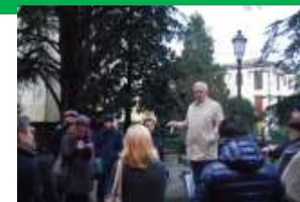
Prossimo intervento di valorizzazione del giardino, quale "porta" di ingresso al centro storico..