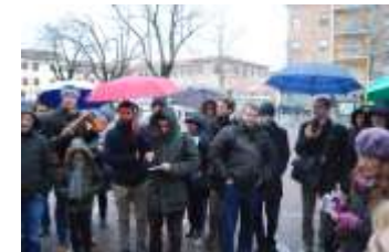
Un parcheggio chiamato erroneamente piazza. Valorizzazione delle tracce storiche ancora leggibili sulla cinta muraria. Costruzioni recenti addossate sono incongruenti. Valorizzazione di visuali e collegamenti pedonali importanti esterni alle mura.