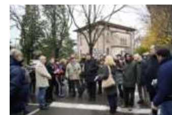
Un parcheggio chiamato piazza. E' un luogo importante per la storia e la memoria locale.