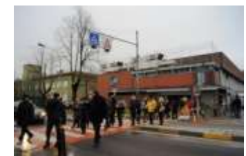
Il VOX: una identità misconosciuta?