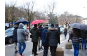
Via V. Veneto insicura per i pedoni: tra auto parcheggiate e in movimento, barriere, recinzioni, dislivelli, cartelli e pattumiere.. non si sa bene dove è meglio camminare e attraversare.