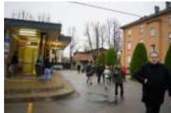
Luogo di socialità e di relazioni dove si mescolano nuovi e vecchi abitanti.