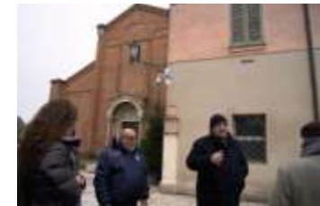
La riapertura dell'Abbazia dopo il terremoto rappresenta uno dei volani della ripresa dell'economia locale e della rigenerazione della città