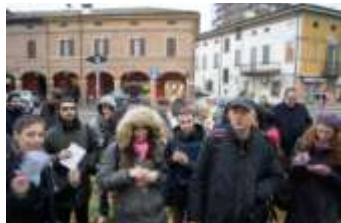
Alta perché sopraelevata rispetto al canal Torbido: una storia sotterrata da recuperare.

Su queste premesse si sono indagati gli elementi che si ritiene importante valorizzare per creare la "rete delle identità di Nonantola" e quali interventi ed azioni possono risultare utili all'una o all'altra prospettiva o alle due congiuntamente.