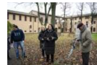
Storicamente il luogo della socialità, degli incontri, delle feste e del gioco ... era uno spazio realmente multifunzionale . Ora poco frequentato.