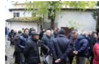
Giardini, spazi interclusi, piccoli edifici, passaggi da riqualificare per realizzare un nuovo "anello" pedonale.