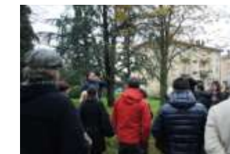
Oggi sono giardini in cui non viene mai nessuno. Sarebbero da valorizzare e creare un "percorso verde" che li connetta ai giardini dell'Abbazia.