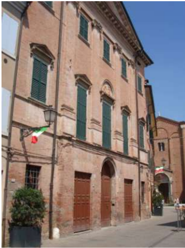
Palazzo Previdi – Via Roma (fronte)