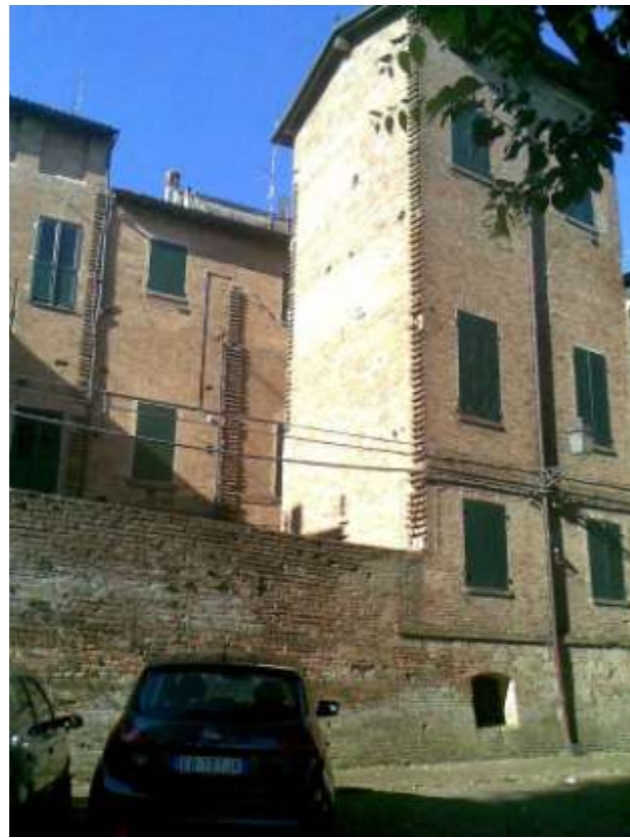
Palazzo Previdi – Via IV Novembre (retro)