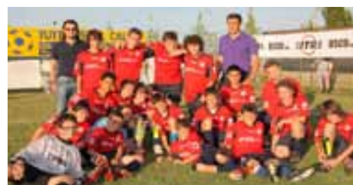
Gli esordienti del Nonantola - Torneo Zucchelli