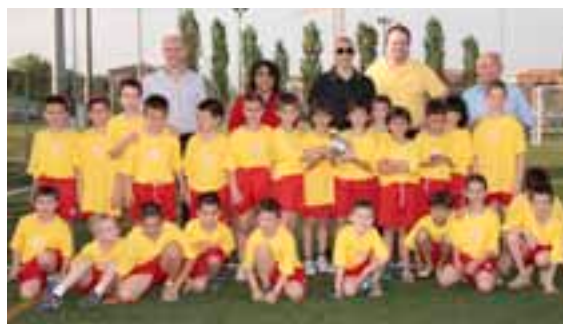
La squadra nonantolana che ha partecipato al Torneo Pasqualon

Il "Memorial Zucchelli", torneo regionale di calcio giovanile che si svolge tradizionalmente nelle prime tre domeniche di maggio, è il fiore all'occhiello della Polisportiva, e anche quest'anno ha visto la partecipazione di 40 squadre composte da ragazzi di età compresa tra gli 8 e i 12 anni, con 1500 persone tra atleti, tecnici e genitori che durante la manifestazione transitano negli impianti sportivi. I vincitori sono stati Virtus Cibeno per i 2002, U.S. Don Monari per i 2000, e San Marinense per l'98. Nei mesi estivi inoltre gli impianti sono messi a disposizione degli organizzatori del "centro estivo sportivo" per aiutare le famiglie nella "gestione" dei bambini nel periodo delle vacanze scolastiche. Un lavoro importante reso possibile grazie a tutti quei volontari che dedicano il loro tempo per ottenere il buon funzionamento di questa attività. In Polisportiva si praticano poi svariati sport quali pallavolo, calcio, tennis, ciclismo, danza, pesca, bocce, Judo, Karate, atletica e ginnastica adulti. Obiettivi per il futuro? Cercare di essere sempre di più un punto di riferimento per tutti coloro che vogliono fare sport in un ambiente sano.