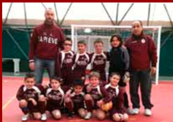
La categoria Pulcini della Pieve