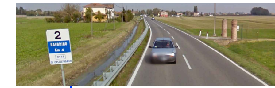
SP 14 DI CASTELFRANCO KM 4

IL COMPARTO OGGETTO DI INTERVENTO PP BIBBIANA NUOVA E' COMPRESO TRA IL KM 4 ED IL KM 5 DELLA SP 14 DI CASTELFRANCO