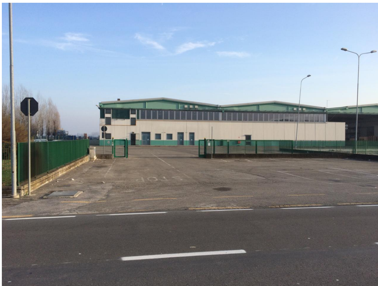
FOTO N° 4