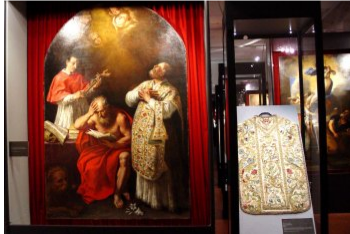
Bonaventura Lamberti (Carpi, 1652 - Roma, 1721), I Santi Carlo Borromeo, Girolamo e Filippo Neri, Carpi (Mo), Chiesa di Sant' Ignazio di Lodola, olio su tela, a fianco Pianeta di manifattura modenese, prima metà sec. XVIII, Nonantola (Mo), Chiesa abbaziale di S. Silvestro I Papa